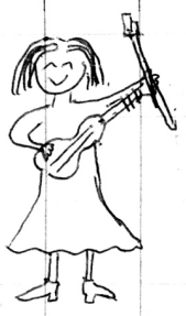
(1) 優雅 (2) 剛剛